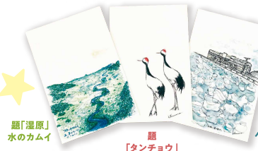
題「湿原」 水のカムイ