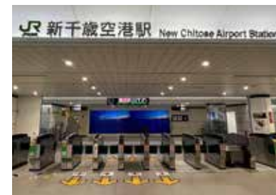
8 승차장은 JR신치토세공항역 지하 2층에 위치하고 있습니다.