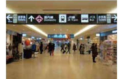
3 국내선 여객터미널 도착 후에는 상점가를 따라 직진합니다.