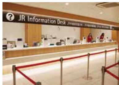
7 JR정보 외국어 안내데스크에서는 레일패스를 교환하거나, JR 승차권을 구입할 수 있습니다.