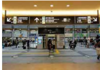
4 상점가를 지나면 국내선 여객터미널 엘리베이터가 있습니다.