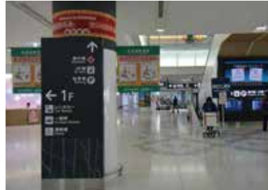
1 국제선 여객터미널 2층 도착로비 부터 출발합니다.

신치토세공항 국제선터미널에서 삿포로시내까지 열차를 이용하시면 매우 편리합니다. 신치토세공항~삿포로역 사이에 구간 쾌속 Airport, 쾌속 Airport, 특별 쾌속 Airport가 운행되어 있습니다. 국제선터미널에서 JR신치토세공항역까지 가시는 길은 아래를 참조해 주십시오.