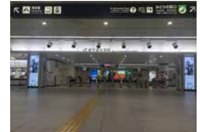
6 지하 1층 엘리베이터 오른쪽으로 JR정보 외국어 안내데스크가 위치하고 있습니다.