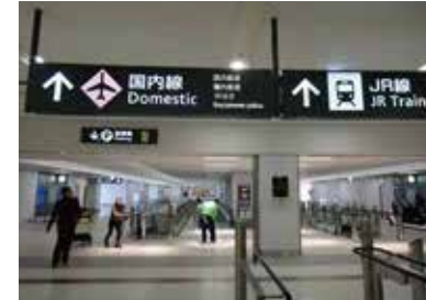
2 국내선 여객터미널까지 약 240m 길이의 연결통로를 따라 이동합니다.