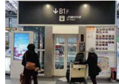
5 엘리베이터를 타고 지하 1층으로 내려갑니다.