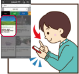
'kokosil' 앱을 미리 다운로드 'kokosil 선택'에서 'JR 홋카이도 연선 관광 가이드'를 선택해 주십시오.