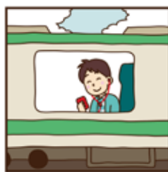
위치에 도착하면 자동으로 음성 안내를 시작합니다.