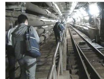
纜車軌道旁的樓梯