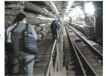
케이블카 선로 옆에 있는 계단