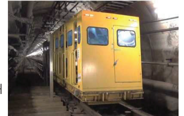
요시오카 정점의 케이블카

케이블카 선로 옆에는 계단이 있는데, 도보로 지상으로 이동하는 것도 가능합니다.