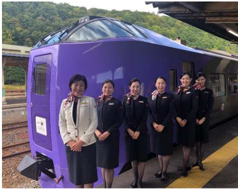
261系5000代 多目的特急車両「ラベンダー」編成と JALふるさとアンバサダー・JALふるさと応援隊(2023年度実施時)