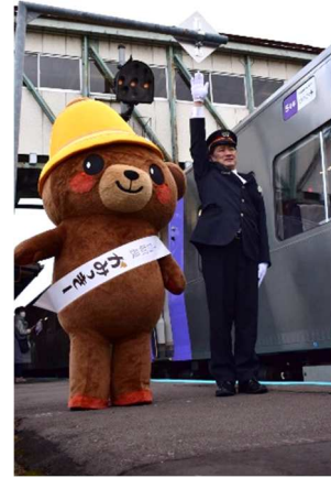
上川駅出発場面(2023年度実施時)

「HOKKAIDO LOVE! ひとめぐり号」は、JR北海道の多目的特急車両「ラベンダー」・「はまなす」編成を使用した特別貸切列車で北海道を周遊するツアーとして、2021年10月から始まり、今年で4回目の運行となります。